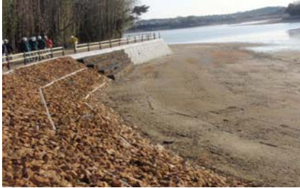
名古屋支部研修風景