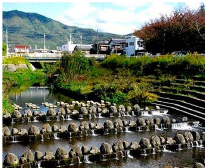
【心なごむ川(蒲郡市三谷町)】

それぞれに、農業・農村への思いが表現された力作で、当研究会より厳選の結果下記作品を「豊かな農地あいち特別賞」として表彰させて頂きました。