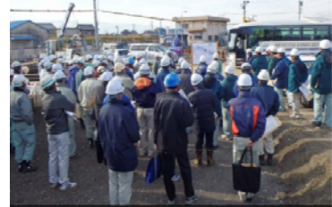
一宮支部 研修風景